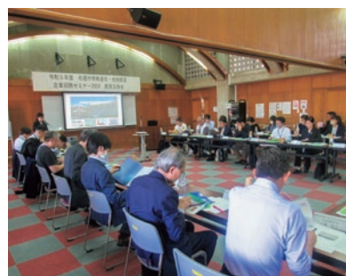
セミナー参加企業や市内企業、 関係団体による意見交換会

たり、視察受け入れや意見交換会などにご協力をいただいた多くの企業・団体の皆さまに、この場をお借りして感謝申し上げます。今後ともご支援ご協力を賜りますようお願い申し上げます。