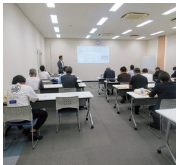
特区進出企業からの説明の様子

○ツアーの概要 ツアー1日目は、貴重な人材を輩出する教育機関である国立沖縄工業高等専門学校や公立大学法人名城大学の視察をしていただく予定です。