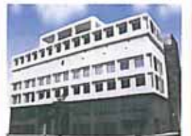
株式会社もしもしホットラインかんなぎビル 名護市産業女性センター

【お問い合わせ】 名護市政策推進部 金融・情報特区推進室 ☎ 53-1212(内241) ✉ itf@city.nago.okinawa.jp