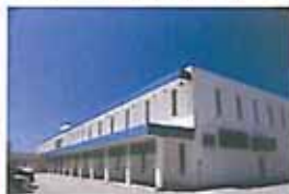
(株)外為どっとコムが入居している 名置市マルチメディア館