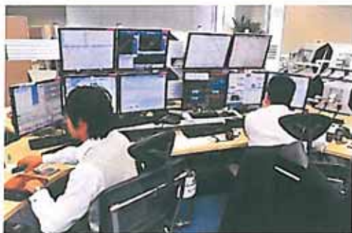
外為どっとコム名置支店内

私が所属するシステム教育課 では、社員研修、人材育成事業の 実施や、イーラーニングを使用し た社員向け教材開発を行っています。